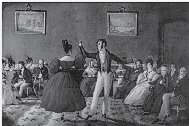
Minué , de Carlos Pellegrini.